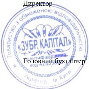
Гоменюк Наталія Анатоліївна