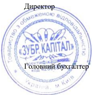
Гоменюк Наталія Анатоліївна